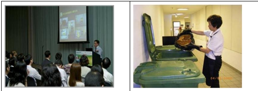
圖 5 - 環保署提供不同類型的支援給主要持份者

為協助並支持工商業機構切實執行正確的廚餘源頭分類、收集和運送至回收中心第 1 期進行循環再造，環保署會向參與的工商業機構之管理層以至前線工作人員提供技術支援，並透過簡介會、培訓和實地考察等講解廚餘源頭分類的方法、收集與運送物流安排等（見圖 5）。