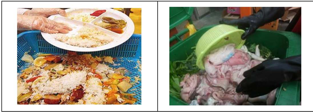
圖 10 - 使用隔篩將廚餘中含過多的水份隔去

請注意： 洗碗後所收集到的廚餘，並不適合用作廚餘回收再造，因殘留在廚餘中的清潔劑會影響厭氧分解過程。