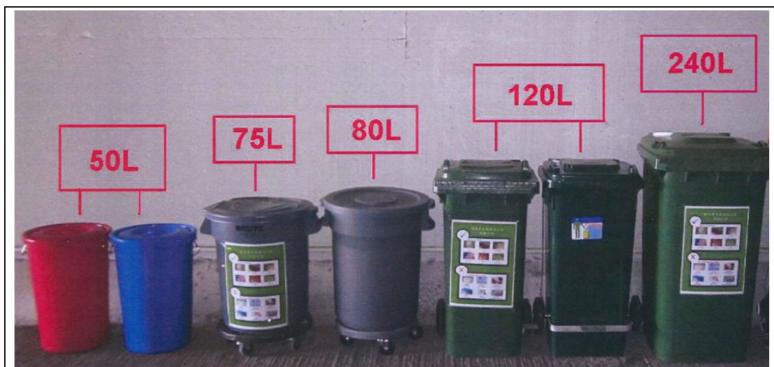
圖 11 - 適當的廚餘收集桶（例子）

基於環境原因，我們不建議廚餘產生者使用膠袋盛載廚餘。然而，若由於衛生或操作原因而不可避免使用膠袋盛載，我們建議廚餘產生者使用透明並可分解的重型膠袋盛載和運送廚餘（如圖 12 所示），既可免廚餘溢漏，亦有助於廚餘收集商在收集和運送廚餘前能進行適當的目測檢查。另外，不應使用紅色或黃色的膠袋，以免與標準的醫療廢物袋混淆。如廚餘收集商/ 廚餘產生者有意採用膠袋盛載廚餘，並有意使用綠色採購，可參考以下兩個互聯網超連結，內載一些環保採購及部分本地可降解膠袋供應商名單（未經政府特別認可）：