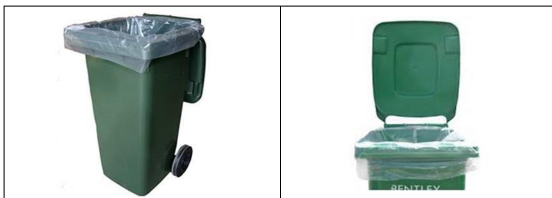
圖 12 - 可分解的透明膠袋（例子）

https://www.wastereduction.gov.hk/tc/household/Supplier_List.htm