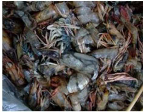
肉類、魚類、魚鱗、有殼海產及小型骨頭