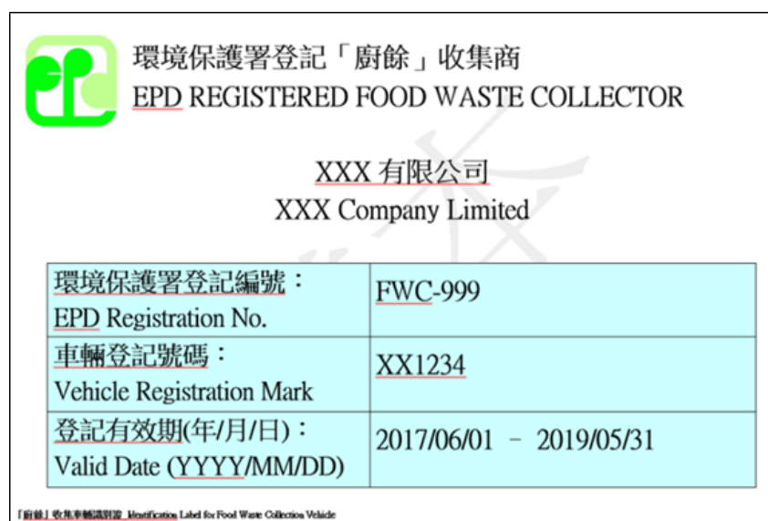
圖 16 - 廚餘收集商的車輛識別證

成功向環保署登記的廚餘收集商，會獲發已過膠的廚餘收集車輛識別證（見圖 16）。識別證應展示於收集車輛擋風玻璃左下角的顯眼位置。沒有識別證的車輛將不允許進入回收中心第 1 期。