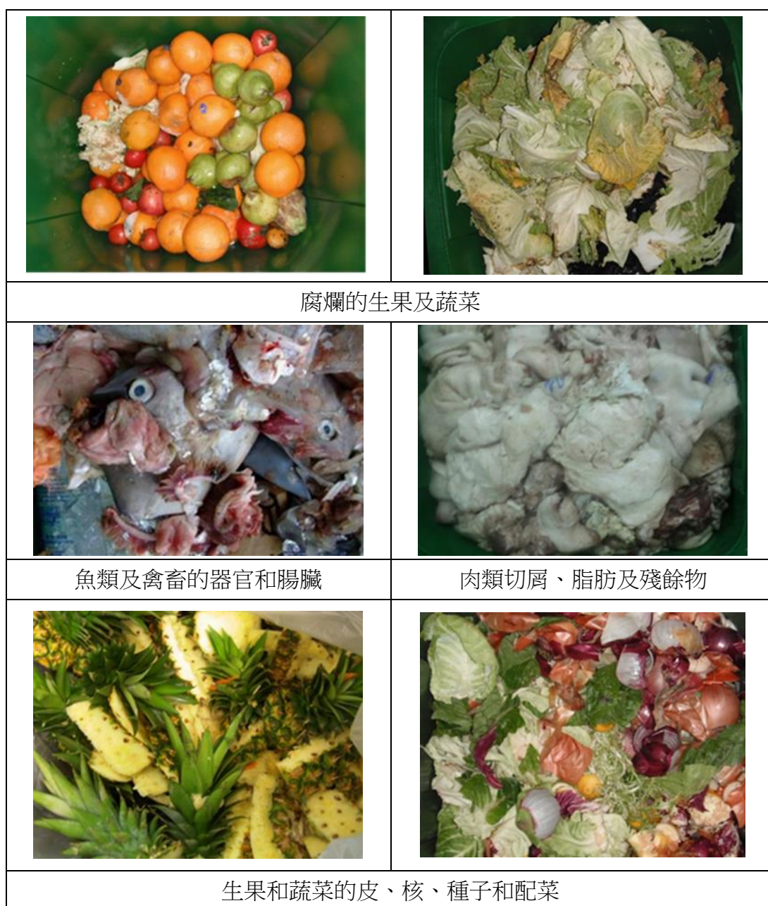
圖 1 - 已源頭分類廚餘 (例子)

廚餘 是指任何在食物製作、分發、貯存及預備膳食或用膳過程中產生的廢物，包括生／熟食物、可食用及不可食用的部分。 源頭分類廚餘 包括餐前廚餘及餐後廚餘(見圖 1)，都是從都市固體廢物中源頭分類出來。有效的源頭分類是保障優質廚餘運送至回收中心第 1 期的一個先決條件。