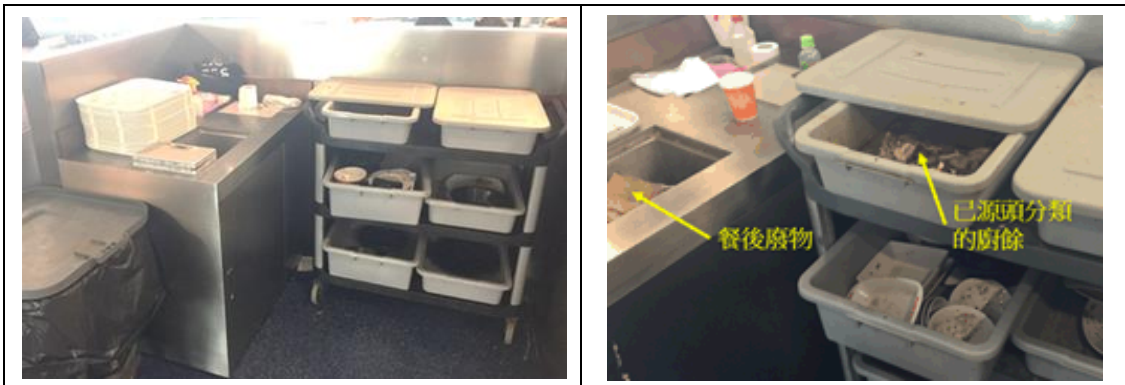
圖 9 - 使用不同容器有助餐後廚餘分類

為避免廚餘中含有過多的水份，例如糖漿和湯，應使用隔篩將多餘的水份盡量瀝乾排走，以方便廚餘收集和運送（見圖10）。