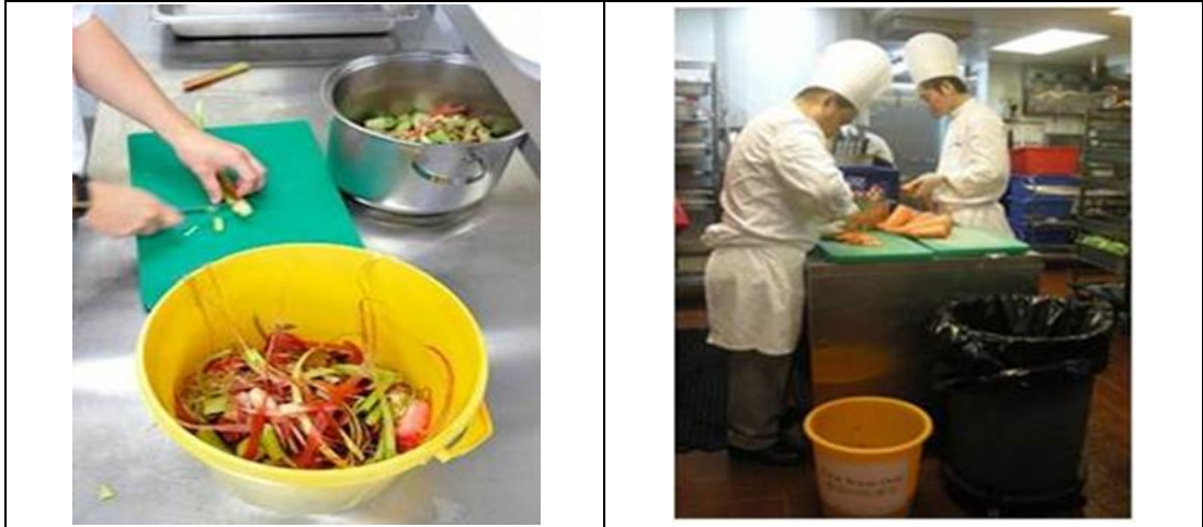
圖 8 - 餐前廚餘分類

餐後廚餘一般需靠人手分類，清潔員工應將廚餘和惰性物質分別放於兩個不同的容器內（見圖9）。對於需處理大量餐後廚餘的廚餘產生者，例如餐飲服務供應商和食品製造商，建議使用半自動輸送帶系統協助將廚餘分類。