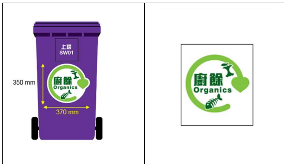
圖 13 - 廚餘收集桶標識（待定）

每個貯存廚餘的收集桶均須貼上一個正確的標識，如圖 13 所示，以區分廚餘收集桶及都市固體廢物箱。標識可向環保署查詢及索取，並必須穩妥地貼於收集桶上的顯眼位置，以確保標識上的資料清晰易見。建議廚餘收集商為每個廚餘收集桶編製參考號碼，以便記錄廚餘的重量/ 數量。