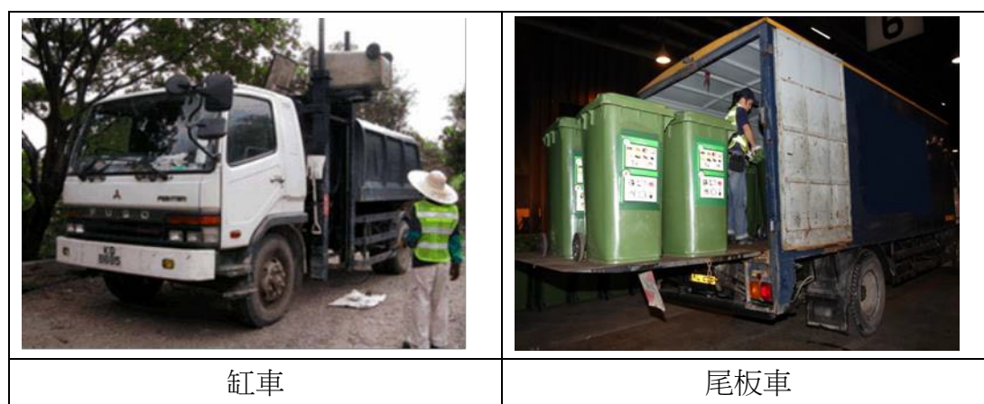
圖 15 - 廚餘收集車輛的種類